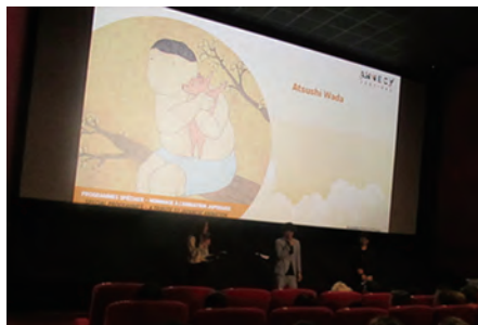
メディア芸術海外展開事業 アムシー国際アニメーション映画祭2019 公式上映