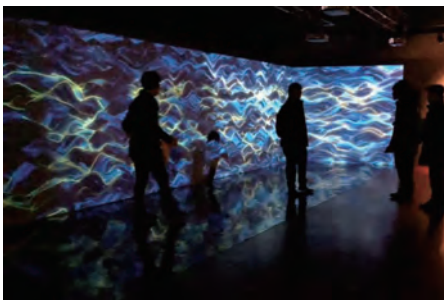
文化庁メディア芸術祭 小樽展「メディアナラティブ ～物語が生まれる港街で触れるメディア芸術」（令和元年度）

文化庁メディア芸術祭での受賞は、海外のフェスティバルへの出展や創作活動の支援等、関連事業を通じた新たな活動にもつながります。「文化庁メディア芸術祭地方展」では、受賞作品を中心に優れたメディア芸術作品を国内各地で展示・上映し、「メディア芸術海外展開事業」では、海外のメディア芸術関連のフェスティバル等で受賞作品等を紹介します。また「メディア芸術クリエイター育成支援事業」では、文化庁メディア芸術祭において受賞もしくは審査委員会推薦作品に選ばれた若手クリエイターを対象とし、新しい作品の企画を募り、制作費の支援や専門家によるアドバイスの提供等、創作活動を支援するとともに、海外の優れたクリエイターを招へいし国際交流を推進します。