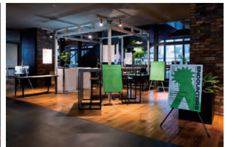
令和元年度メディア芸術クリエイター育成支援事業 成果発表イベント