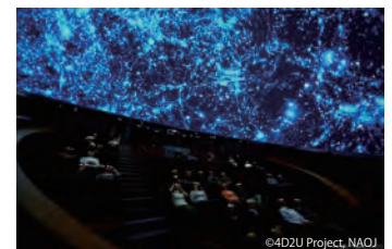
ドームシアターガイア

ドームシアターガイアは、直径15.24 m、傾斜角23°のドーム型スクリーンに、全天周映像を4Kの解像度で2D及び3Dで投影することができる球体映像システムです。