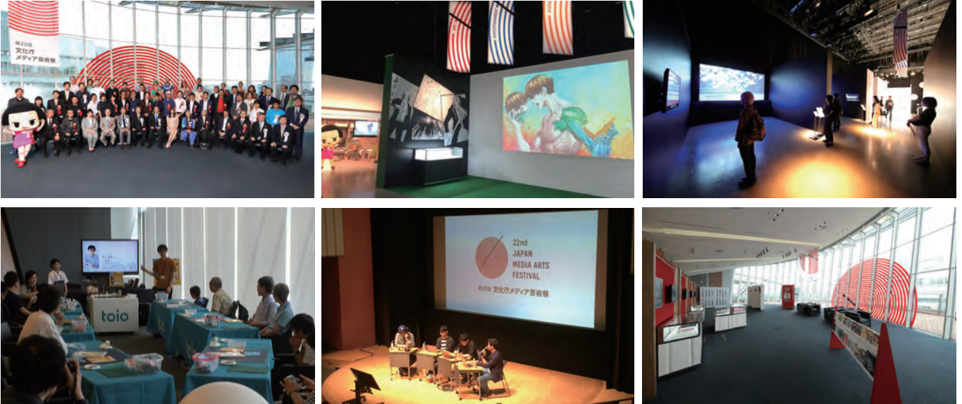
第22回文化庁メディア芸術祭 受賞作品展の様子